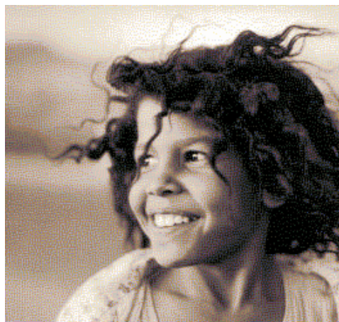
Imagen secreta oculta