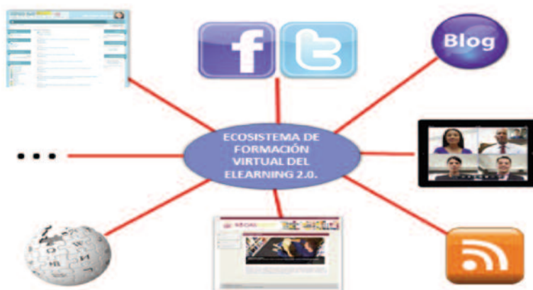
Fig. nº 1. Ecosistemas de formación virtual del e-learning 2.0.

El entorno que se creará, será desde un punto de vista mediático más variado que el elaborado para e-learning 1.0, que fundamentalmente se centrará en el LMS seleccionado y en las herramientas de comunicación síncronas y asíncronas que posea la plataforma. Por el contrario en el e-learning 2.0, el alumno interactuará en un verdadero ecosistema de formación virtual: blog, wiki, LMS, redes sociales,... (fig. nº 1).