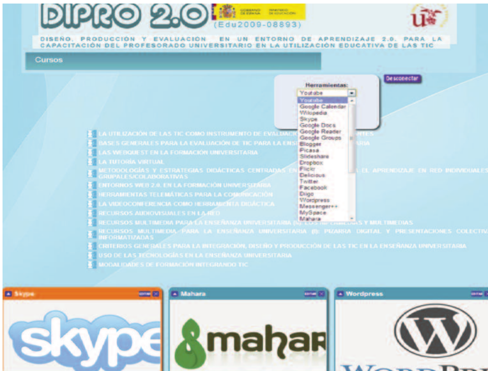
Fig. nº 2.- Imagen entorno Dipro 2.0.

Por lo que se refiere a los PLE nosotros a través de un proyecto de investigación denominado “Diseño, producción y evaluación de un entorno de aprendizaje 2.0 para la capacitación del profesorado universitario en la utilización educativa de las Tecnologías de la Información y Comunicación” (Dipro 2.0-EDU2009-08893), financiado por el Ministerio de Ciencia e Innovación (Cabero y otros, 2011; Infante y otros, 2013), diseñamos y producimos un entorno donde se combinaba un LMS (Moodle) con la posibilidad de configurar un entorno enriquecido con diferentes herramientas de la web 2.0. (fig. nº 2).