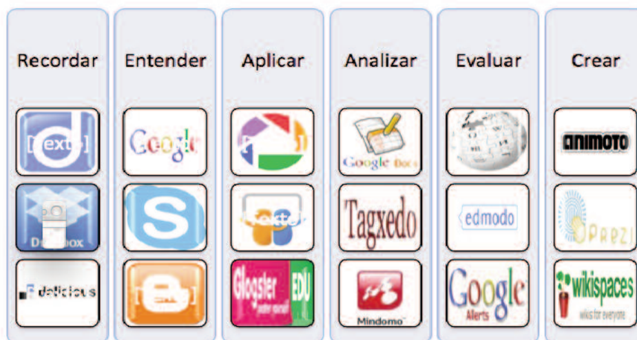
Fig. n° 4. Ejemplos de App asociadas a diferentes categorías de la taxonomía de Bloom.

combinan los elementos estructurados del aprendizaje formal, la naturaleza autodirigida del empleo informal del aprendizaje y las tecnologías nuevas y poderosas de la web 2.0 para apoyar las necesidades de formación de la persona en su viaje de aprendizaje personal (Schlenker, 2008).