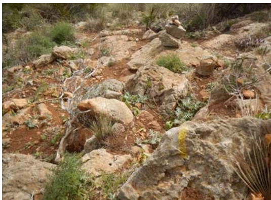
Figura 5. Hitos y señales