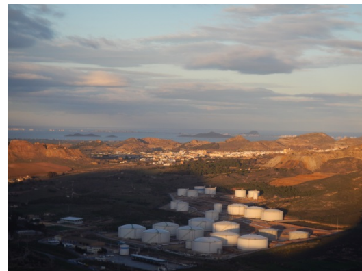
Figura 6. Vistas desde la cima