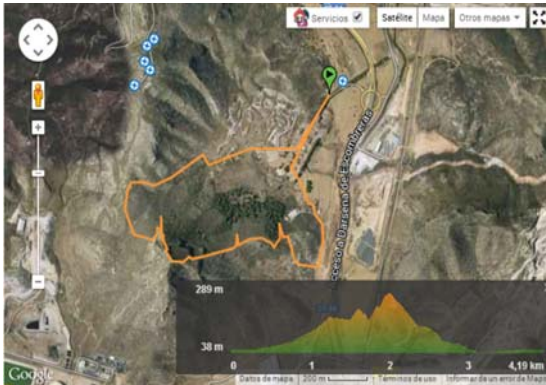
Figura 3. Recorrido y perfil

Gracias a la diversidad de escenarios en los que transcurren las vías ferratas, podemos aproximar a nuestros alumnos a otras actividades en el medio natural como senderismo, ya que muchas de ellas precisan de un itinerario previo y otro final para regresar al medio de transporte. Igualmente, el trabajo de la orientación se podría incluir en estas prácticas, facilitando a nuestros alumnos un mapa de la zona en concreto y fijando una serie de postas hasta el inicio de la misma vía ferrata y una vez allí, hacerla todo el grupo. Las hay también que combinan tramos de escalada y de rapel u otras que transcurren cerca de un barranco en la que se podría planificar esta y otras actividades en varios días.