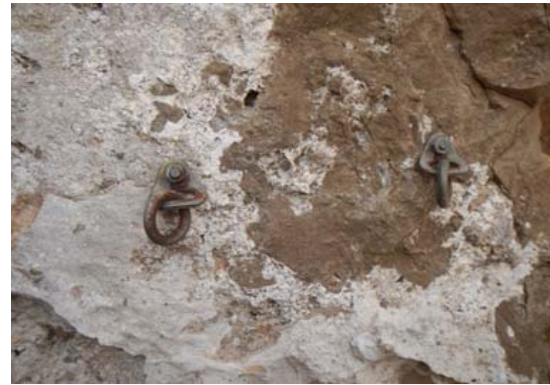
Figura 4. Reunión con anillas y chapas