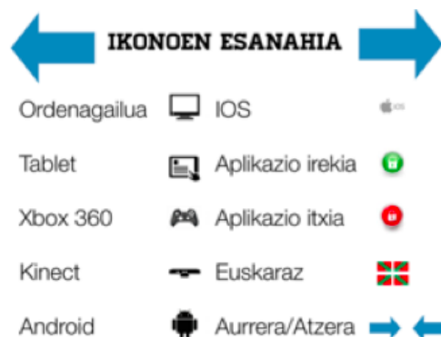
Figura 3. Guión explicativo de la iconografía utilizada en la revista para exponer las características de cada aplicación.

“...estaba clasificada dentro de diferentes ámbitos... lo que queríamos es que se hicieran de la manera lo más comprensible...” [A.E.02]