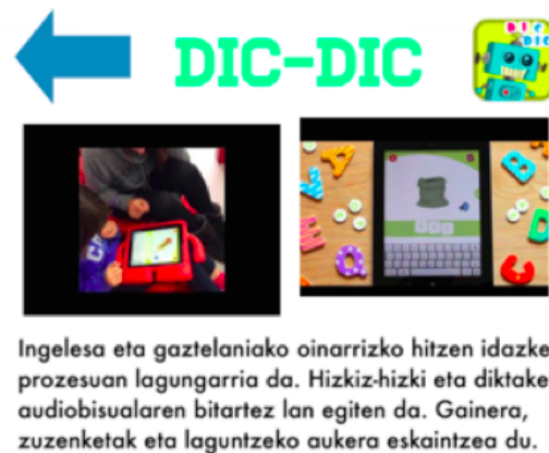
Figura 2. Hoja de la revista digital donde se encuentra el acceso al video-tutorial

“veíamos que había tutoriales de veinte minutos o en inglés...que no se entendían muy bien y lo que buscábamos es que se hicieran de una manera más entendible.” [A.E.02]