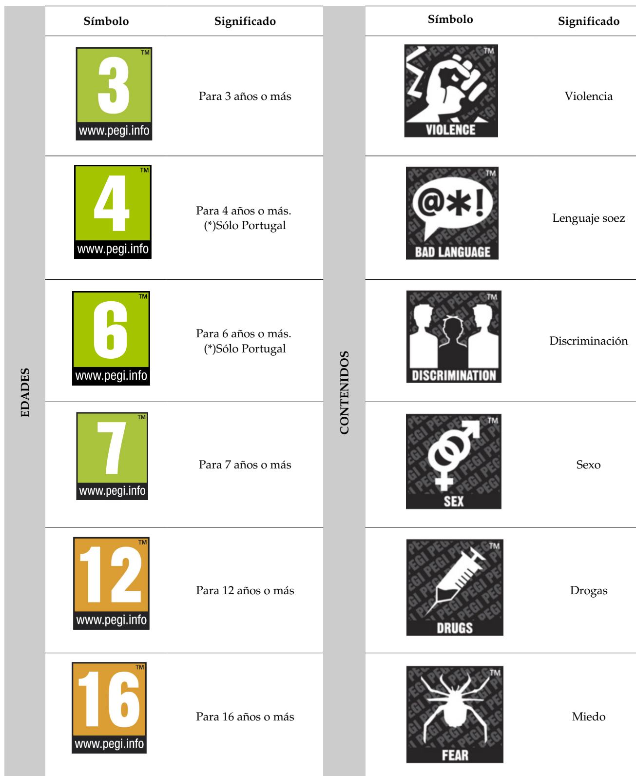
Tabla 1. Clasificación PEGI.