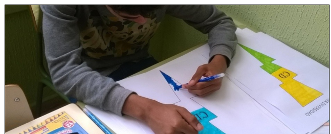
Se crea una logo que identifique la cooperativa

Encontrar una imagen que les identificara como grupo fue un reto y una experiencia muy motivadora.