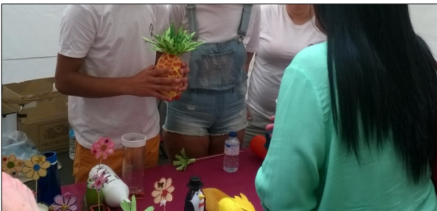
Punto de venta

Este último taller se inicia con la solicitud por parte del equipo directivo de la cooperativa del permiso de venta al ayuntamiento de la localidad donde se realizaría la feria. Se siguió un procedimiento bastante formal, con la presencia del alumnado en el citado ayuntamiento, lo que le permitió tomar conciencia de la necesidad de este trámite en el proceso de fabricación y venta de los productos. Una vez obtenido el permiso, las actuaciones se encaminaron a la preparación del punto de venta, en el que sería necesario el reparto de tareas, teniendo en cuenta aptitudes e intereses personales. Se formaron tres grupos: cajeros, publicistas y equipo de atención al cliente, aportando incluso la manera en que debían acudir vestidos para ayudar a ser identificables como grupo.