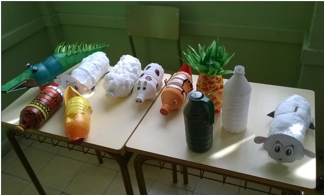
Las ideas se van materializando en distintos productos...¡la motivación aumenta!

Los primeros productos elaborados lograron incentivar la participación y colaboración de todo el alumnado ya que, hasta los más incrédulos comprobaron la posibilidad de realización de una idea. En esta etapa se puso de manifiesto el desarrollo de la autonomía por parte del alumnado y la cohesión grupal mediante el trabajo colaborativo. Las ideas se hacían realidad y el profesorado se convertía en mero guía del aprendizaje.