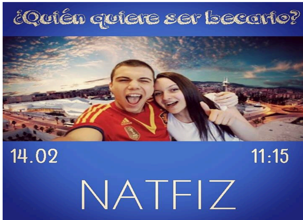
FOTO DE PORTADA O PROGRAMA

La Consejería de Educación, ha organizado el concurso 10 preguntas que darán a nuestro valiente concursante la posibilidad de pasar un año estudiando en Granada con todos los gastos pagados. ¿Sabrá Misho todas las respuestas? ¿Podrán ayudarle sus recuerdos? ¿Será todo un sueño?