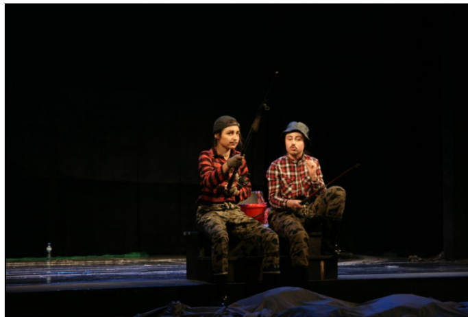
Imagen del estreno.