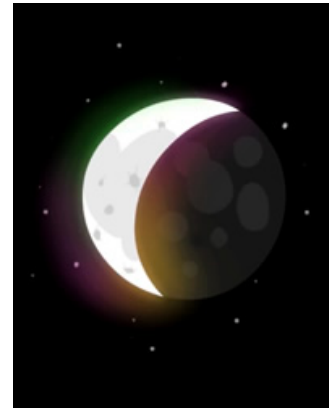
Imagen 1. Aberración cromática.

dificultaban una observación clara y precisa. Tras sus experimentos Newton propuso un modelo de luz de naturaleza corpuscular (fotones) y compuesta por siete colores luz puros que fue inmediatamente atacado por Robert Hooke con otra evidencia experimental: la luz azul y la luz amarilla también suman luz blanca. Este resultado sirve de punto de partida para el siguiente cuento “La historia de los tres colores”.