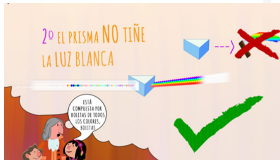
Imagen 3. Hipótesis-conjeturas para explicar el fenómeno.

El estudio de la luz abarca competencias en Ciencias Naturales y Astronomía (percepción de elementos y fenómenos naturales: luna, estrellas, eclipses, sucesión de las estaciones...); en la interacción materia energía, en la innovación y aplicaciones tecnológicas (telescopios).