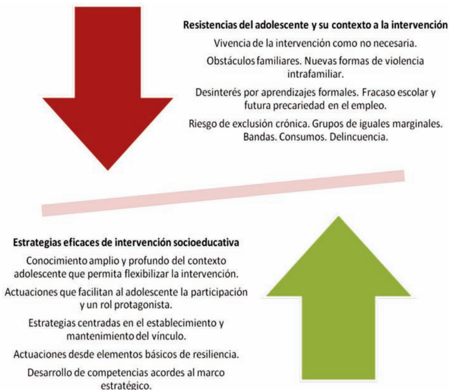
Gráfico 2. Estrategias eficaces y repercusiones sobre las resistencias del contexto adolescente