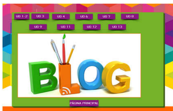
Figura 4. Acceso a los blogs de las unidades didácticas.

Por otro lado, los 15 temas de los que se compone la programación se han trabajado durante las 35 sesiones del curso escolar, a razón de una clase semanal. Además, el nuevo planteamiento de la materia implicó la habilitación del aula Plumier, dotada con 24 ordenadores con acceso a Internet (uno por alumno/a) como aula de Música, con el consecuente traslado de los instrumentos musicales de una a otra. Una vez desarrollada