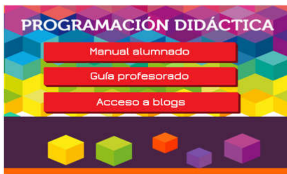
Figura 1. Captura de pantalla de la página principal del entorno Wix creado

En primer lugar, la docente hizo una búsqueda de herramientas en la red que permitieran crear páginas web y como resultado de este proceso se decantó por Wix para su utilización como repositorio de contenido curricular. Wix es una aplicación que permite crear sitios web de forma fácil e intuitiva y ofrece la posibilidad de editar e incorporar materiales multimedia como vídeos, animaciones, texto, audio, imagen... sin necesidad de tener conocimientos previos de programación. Tal y como expresa Cañizares (2013, p. 69), «Wix es una herramienta muy útil para la educación, ya que permite agrupar todo tipo de recursos en distintos soportes dentro de una misma web». Una vez que la maestra diseñó y digitalizó los materiales, se familiarizó con el manejo de Wix y creó el dominio http://cmariaazorin.wix.com/universa en el que se alberga la programación didáctica online a la que nos venimos refiriendo. En la Figura 1 se presenta una captura de pantalla de la página principal en la que aparecen tres botones virtuales que llevan por título (1) «Manual del alumnado», (2) «Guía del profesorado» y (3) «Acceso a blogs».