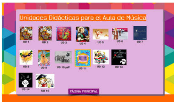
Figura 2. Recursos para el alumnado (libro digitalizado)

Al pulsar con el ratón en el primer nivel (manual del alumnado) aparecen ante el usuario las imágenes en miniatura que representan el logo del material creado ad hoc para cada una de las unidades didácticas (Figura 2).