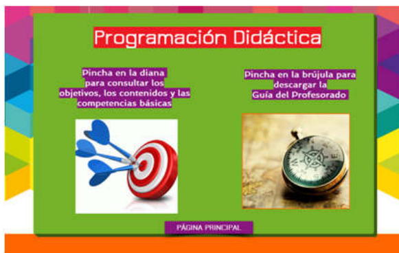
Figura 3. Recursos para el profesorado (guía docente).

de la unidad número 5 (que coincide con la festividad navideña y los ensayos de las actuaciones musicales que se celebran en estos días, por lo que hay menos tiempo para trabajar en el aula de informática), la unidad número 10 (en la que el alumnado pidió grabar un corto de cine mudo a lo que la maestra accedió de buen grado, sustituyendo la visita al blog por esta otra actividad) y las unidades 14 y 15 (en las que se dedicó un esfuerzo mayor a los preparativos de la graduación del alumnado que finalizaba la etapa y al concierto fin de curso).