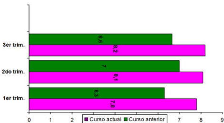
Gráfico 1. Nota media global del grupo clase por cursos.

docente un aire renovado y cercano a los intereses de los discentes. A partir de la herramienta Wix se ha creado una página web que alberga el contenido curricular, confirmándose que su uso como repositorio ha resultado factible y ha favorecido que en un mismo espacio se encuentre todo lo necesario para el desarrollo del proceso