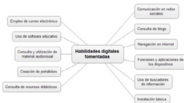
Fig. 6. Habilidades digitales que han desarrollado los docentes y los estudiantes.

Con respecto a las habilidades digitales que han desarrollado los docentes y los estudiantes, en el programa PIAD, se obtuvieron las categorías de respuesta, las cuales se presentan en la Figura 6.