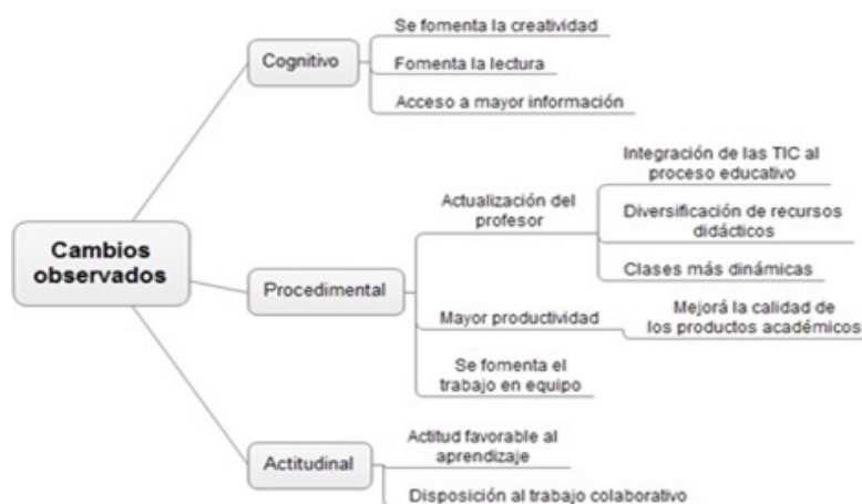
Fig. 5. Cambios en las dinámicas de enseñanza tras la inclusión de los dispositivos móviles en el aula.

Con respecto a los cambios en las dinámicas de enseñanza tras la inclusión de los dispositivos móviles en el aula, los directivos destacaron situaciones concretas que impactan a las tres dimensiones del aprendizaje: a nivel cognitivo, procedimental y actitudinal (ver Figura 5).