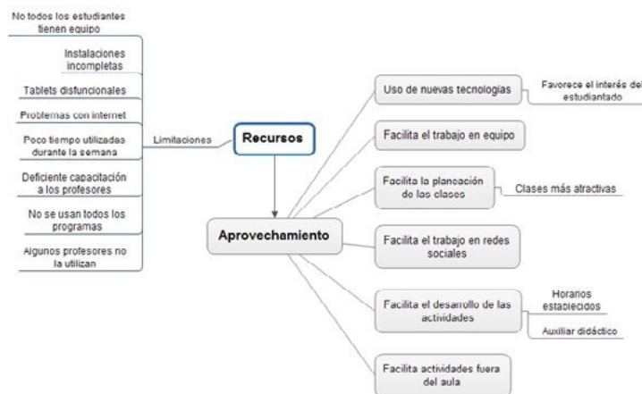
Fig. 4. Aprovechamiento y limitaciones de los recursos educativos del programa Mi Compu.Mx y PIAD.

Con respecto al aprovechamiento de recursos educativos del programa se encontró que las autoridades educativas federales [consideraron] que los recursos proporcionados para la operación del programa PIAD, se emplearían de manera eficiente, impactando directamente en el aprovechamiento escolar, sin embargo, como ocurre en todos los programas para el fortalecimiento de la calidad educativa, existen diversas situaciones del contexto local que limitan el cumplimiento de los objetivos. Situaciones que no fueron previstas y que afectaron la funcionalidad de programa (ver Figura 4).