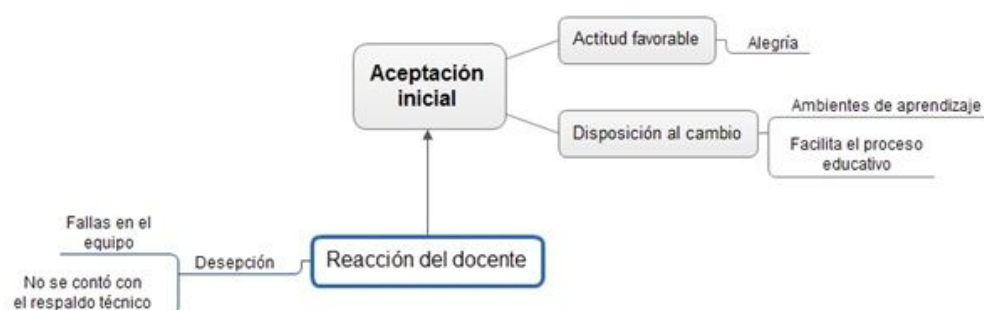
Fig. 2. Respuesta de los profesores hacia la implementación de los programas Mi Compu.Mx y PIAD.

La reacción de los docentes para la implementación del Programa de Mi Compu.Mx, se generaliza