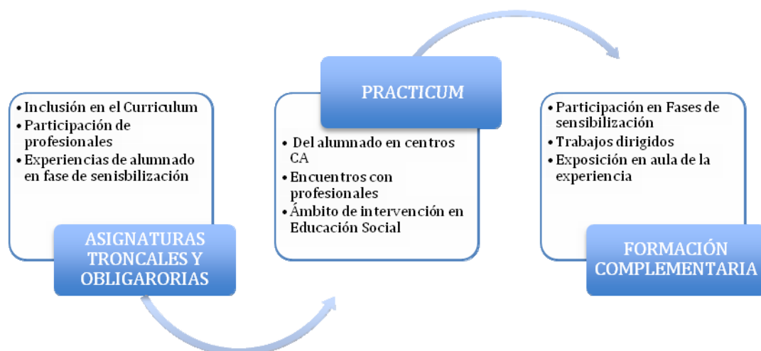
Gráfico 2. Relación entre las diferentes acciones formativas

Precisamente, CA es un escenario educativo propicio para ello, puesto que desarrolla no sólo formas organizativas democratizadoras de la acción educativa (como por ejemplo, el sueño colectivo, comisiones mixtas, contratos de aprendizaje, participación de agentes en las dinámicas de las aulas), sino también porque utiliza metodologías asentadas en el diálogo (grupos interactivos, tertulias dialógicas...). Por todo ello hemos articulado en diferentes contextos de la formación inicial (asignaturas troncales y obligatorias, el Practicum, trabajos dirigidos y voluntariado para créditos de libre elección) la relación con la red de Comunidades de Aprendizaje. En el Gráfico 2 quedan reflejados estos contextos, que pasaremos a describir posteriormente.