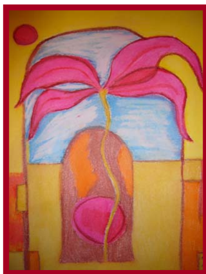
Figura 3. Dibujo realizado por una alumna talento en expresión plástica

7.- Sesión de arteterapia y relajación; dibujo musical. Escuchamos el álbum de Enya (Watermark) con una duración aproximada de 40 minutos. Se ofrece total libertad a los discentes para que dibujen aquello que les inspira esta música y lo plasmen en una cartulina utilizando cualquier tipo de material: témperas, rotuladores, lápices de colores, acuarelas, plastilina, papel celofán, ceras, purpurina, etc. Un ejemplo de este trabajo puede verse en la figura 3. Con esta actividad, nuestro propósito es dejar volar la imaginación, fomentar el desarrollo de la creatividad y la expresión libre del alumno a través de su relación con la pintura y la música. Para la realización de esta tarea, se establece una estrecha colaboración y coordinación entre las maestras de la asignatura de música y de plástica para trabajar de forma conjunta en el aula (enseñanza compartida). Las obras creadas se guardan para su posterior exposición en los pasillos del centro escolar durante la Semana Cultural del Centro próxima en el tiempo a esta experiencia de innovación (la música de Enya se encuentra disponible para su audición en la página del edublog titulada “Relajación y dibujo: Enya”).