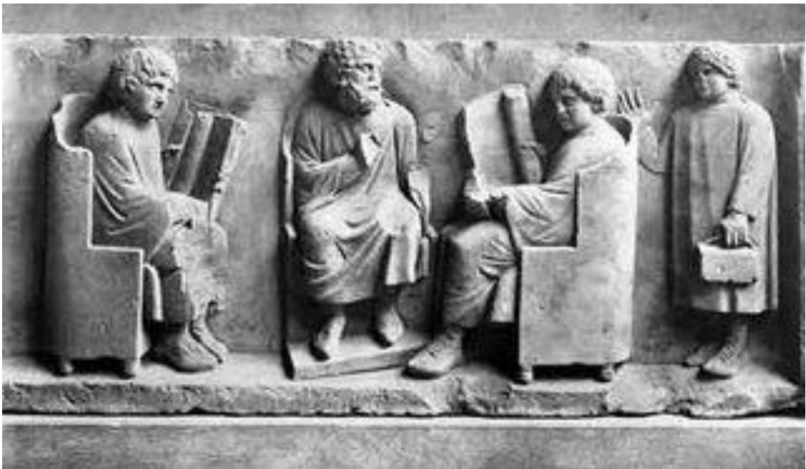
Bajorrelieve procedente de Tréveris (fines del siglo II) en el que se representa una escena tipo de escuela romana. Conservado en el Rheinisches Landesmuseum.

“Había que llegar a la palestra con el amanecer, bajo pena de castigo, para ejercitarse en las carreras, los saltos, el pugilato, la lucha, el lanzamiento de disco y de la jabalina. Más tarde, de regreso a casa, vestido con una túnica y sentado en un escabel, el estudiante leía delante de su maestro, cuidando mucho de no tropezar en una sola sílaba si no quería ser golpeado hasta que su piel pareciera el manchado delantal de una nodriza” (Plauto. Bacchides , 11, 420-435).