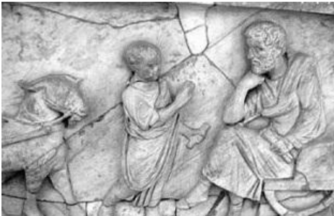
Sarcófago de Marco Cornelio Statio (siglo II) en el que se representa a un niño recitando la lección al tutor. Conservado en el Musée du Louvre.