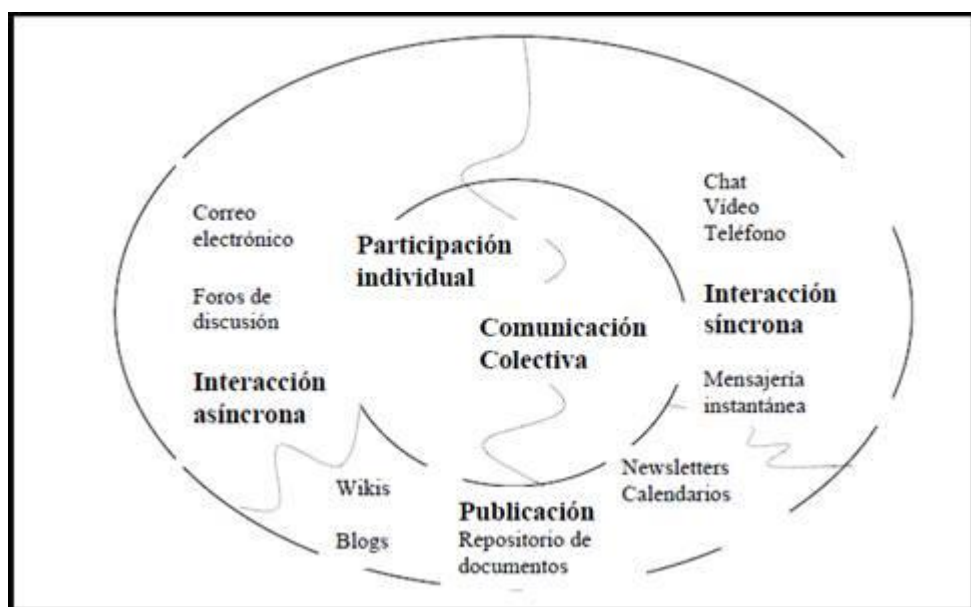
Figura 1. Herramientas para comunidades (Sanz, 2010: 121)

Fresneda (2011) plantea que sea Moodle la base para desarrollar una comunidad virtual de aprendizaje. Además de justificar esa decisión, enumera las utilidades con las que contaría la misma: