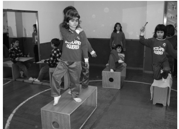
Figura 5. Trabajo corporal y sonoro sobre diversas esculturas de la ciudad de Figueres

trumental, y la corporal, concluye de forma global y participativa todo el trabajo realizado por separado. Resumiendo, el trabajo corporal, trasponiendo con el cuerpo y el sonido la visualización de la escultura, permite a los alumnos que participan activamente y a los espectadores que lo visualizan y escuchan una lectura enriquecedora y diferente del acto de percibir un objeto artístico, en este caso una escultura urbana.