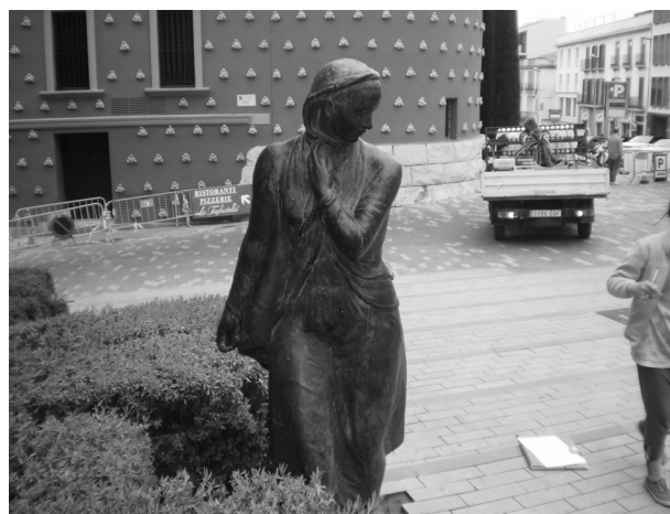
Figura 3. Escultura «La Tramuntana» del escultor Llorenç Cairó (Figueres)

Las pautas básicas de este trabajo han sido la construcción y deconstrucción del bloque escultórico y del sonido ambiental de la escultura y su entorno. Esto se ha hecho a través del movimiento corporal a imagen de las esculturas originales, con música y sin ella.