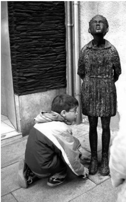
Figura 6. Escultura «Sense lluna» (Sin luna) de la escultora Anna Manel·la (Olot)