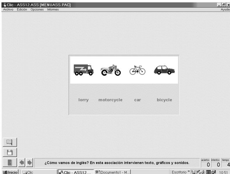
Figura 1. Actividad del Clic (asociación).

Para diseñar una actividad con Clic, hay que indicar al programa cuáles son los elementos que aparecerán en escena: textos, gráficos, sonidos, animaciones... De este modo, se pueden manipular distintos archivos multimedia, incluso desde ordenadores de escasas prestaciones u obsoletos. La selección de estos elementos se puede hacer de manera directa (seleccionando un archivo en una lista donde se muestran los textos y las imágenes disponibles) o mediante llamadas indirectas.