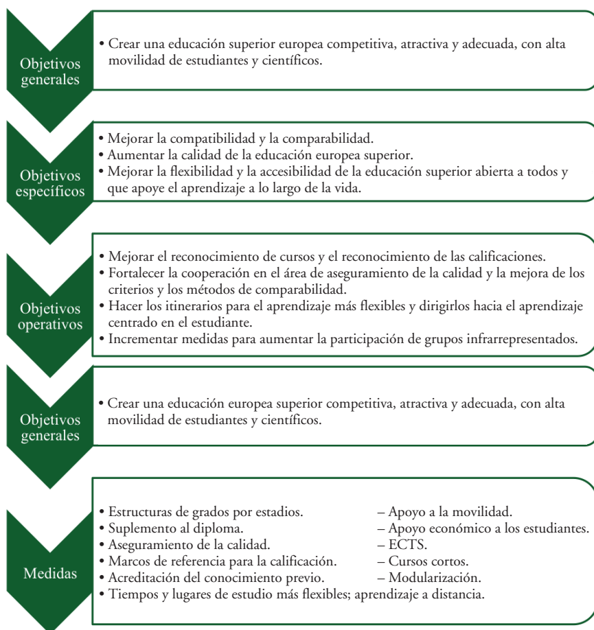
Figura 1. Objetivos y medidas del proceso de Bolonia.