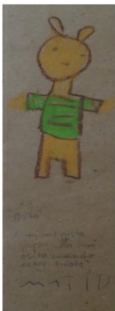
Juegos y juguetes observados como instancias de soporte emocional

tadores de información, de memoria y de afectos. Muchos de los juguetes fueron descritos como “cosas importantes”, especialmente porque en situaciones difíciles, acuden a ellos. Durante el proyecto se repiten frases como: si estoy triste me voy a mi pieza con mi muñeca; juego a la pelota solo; veo tele con mi osito . Los dibujos son muy evidentes al mostrar ciertos juguetes como elementos segurizadores. Ositos, autos, pelotas, van conformando la atmósfera donde los niños y niñas se sienten protegidos/as y, de algún modo, al margen de sus propias penas o dificultades.