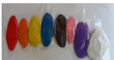
Cuncuna Emma: objeto que puede ser exhibido en un museo, según la opinión de los niños y niñas del proyecto.

Los niños y las niñas de este proyecto concluyeron que muchos objetos les ayudaron a “traer a la memoria” lo que había sido olvidado. Un resultado interesante, a nuestro juicio, es que lograron señalar con mucha convicción que no hay recuerdos más importantes que otros; que los objetos del museo no son más relevantes que su propio patrimonio y que sólo existen diferentes nombres para el patrimonio: de la humanidad, nacional, barrial o personal.