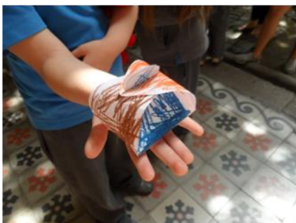
Caja de la memoria donde niñas y niños guardaron sus recuerdos y patrimonios

Una parte importante del proyecto se vivió en los depósitos del museo, pues fue un lugar que permitió conocer de qué manera se mantienen los objetos en el tiempo y, de paso, identificar de cerca la labor de las conservadoras y conservadores de museos. Las y los visitantes, con mascarillas y guantes, realizaron un recorrido por esos objetos no exhibidos. A partir de ese recorrido se reflexionó en torno a los criterios que todas y todos usamos cotidianamente para guardar, exhibir o desechar un determinado objeto. La conclusión fundamental a la que esta audiencia llegó es que lo que conservamos, siempre tiene que ver con los grados de afecto: guardamos lo que es importante y como tal siempre tiene un lugar especial. A propósito de esa reflexión se realizó un taller llamado La caja de la memoria , material que cada estudiante debía armar para guardar en ella algún recuerdo u objeto que considerara inolvidable. La mayoría de ellos guardó momentos familiares y con amigos.