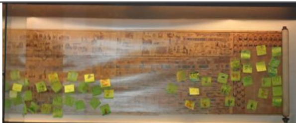
Línea de Tiempo con las pegatinas con “recordatorios”