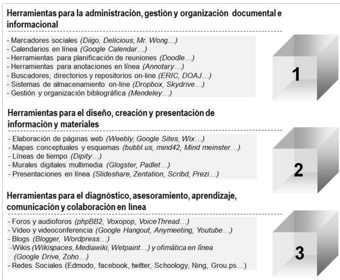
FIGURA 1. Clasificación de herramientas web 2.0 para la orientación educativa

Partiendo de estas consideraciones, ¿cuáles serían entonces las principales herramientas susceptibles de ser utilizadas en la orientación educativa?. Dada la amplia amalgama de aplicaciones basadas en el cloudcomputing, resultaría harto complicado poder ofrecer una respuesta unívoca a esta pregunta. No obstante, en un esfuerzo de síntesis se hará referencia a aquellas webtools que podrían considerarse de mayor utilidad para la acción orientadora en educación secundaria. Para ello, se propone una estructura basada en tres grandes categorías que, además de reseñarlas en la figura 1, se describirán de manera sucinta a continuación.