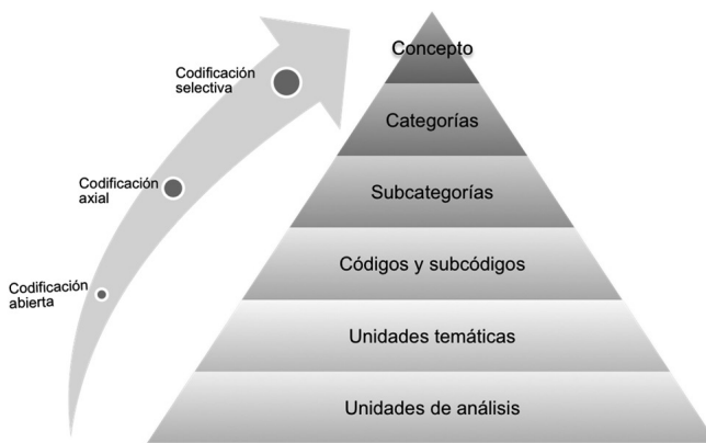
Figura 3. Representación gráfica del procedimiento de análisis cualitativo, siguiendo la propuesta de Flick (2002/2007; Flick, 2014)

Para analizar los datos procedentes de los libros y revistas seleccionados decidimos no ayudarnos de ningún programa de análisis de datos cualitativos que podemos encontrar en el mercado (Atlas.ti, NVIVO, AQUAD 5, etc.), sino que seleccionamos una técnica de análisis manual, con base en las propuestas de Barreto et al. (2011) y de Andreu-Andrés & Labrador-Piquer (2011) y, por medio de un proceso circular dividido en tres fases –(a) separación en unidades: redujimos y simplificamos la información inicial bajo un criterio temático; (b) identificación y clasificación de las unidades: categorizamos y codificamos el conjunto de los datos; (c) disposición y transformación de los datos– identificamos, en las unidades establecidas, los componentes temáticos que permitiesen su saturación y la elevación de los códigos a categorías y, finalmente, proporcionamos una interpretación a estos (véase figura 3).