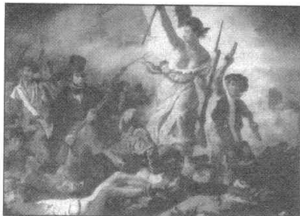
La Libertad guiando al pueblo. Delacroix Revolución Liberal Burguesa Revolución Socialista