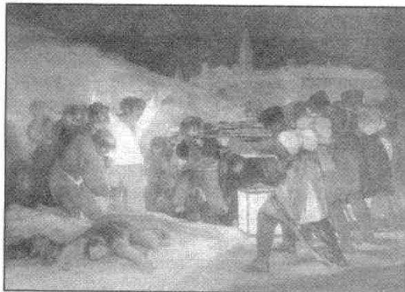
Los fusilamientos del tres de mayo. Goya Revolución Liberal Burguesa