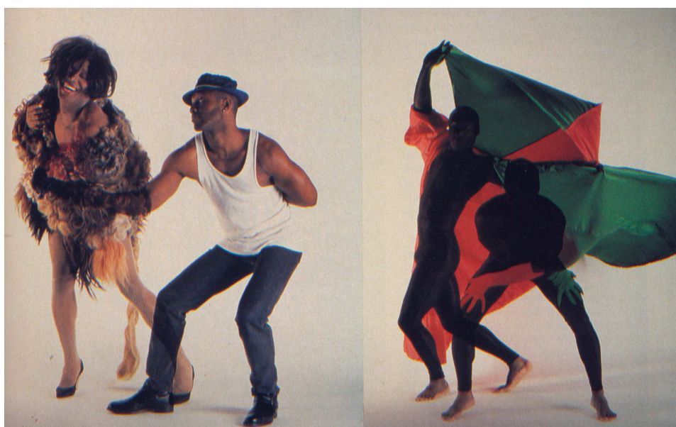
Figura 4. Imatges del performance I/Myself/My Sister (1990), Nick Cave

La primera vegada que vaig veure I/Myself/My Sister va ser el 1990 quan vaig estar al costat de la mare de Nick en el hall del Chicago Cultural Center . Era evident que ella estava orgullosa amb la producció; l'amor incondicional i somrient que ella tenia cap al treball del seu fill va testimoniar-se en l'aprovació clamorosa del públic reunit. Confiat i igualment orgullós de totes les seues identifications, el treball de Cave fa referència a múltiples tradicions i rituals, esdeveniments contemporanis i tecnologies a través de les arts i els mitjans artesanals. Resulta difícil concretar cap definició única en la lectura de la seva obra, ja que Cave s'ha compromès fermament amb la seva visió, la missió de la comunitat, i una sèrie d'exploracions metafòriques que confirmen una enorme amplitud de les seues preocupacions. El treball de Cave no és ni post-racial ni està singularment preocupat pels temes afrocèntrics, com podem comprovar en la seva obra des de 1990. No obstant això, tant a les escoles, com entre els conservadors de museus i per part de les publicacions, de vegades sembla que hi ha un excés per determinar i prescriure com s'ha de llegir la seva obra.