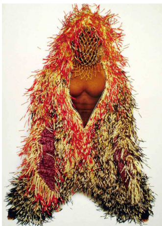
Figura 6. Soundsuit (1999), Nick Cave

Independentment de les regulacions restrictives imposades per l'administració, dels mandats curriculars que configuren successivament els llibres de text, o de les expectatives familiars que han penetrat en la psique dels adolescents, és possible, inclús tranquil·lament, repensar aquestes pràctiques de lectura excessivament simplificades, per superar així les interpretacions heteronormatives de les obres, i centrar el desafiament en les anàlisis formalistes de les obres d'art. Desentranyar les complexes i múltiples capes de preocupacions que integren la gran obra de l'artista suposa involucrar els estudiants en la deconstrucció de les representacions visuals i dels seus significats, explorant les grans preocupacions socials, les diferències i les nocions de diversitat, superiors als que massa sovint havien estat emmarcades.