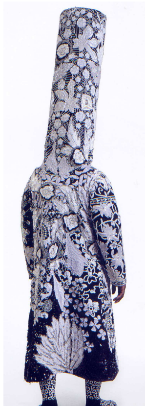
Figura 5. Soundsuit (2007), Nick Cave. Tela, aplics de rocall trobats, lluentons, perles, i filats de punt; armadura de metall