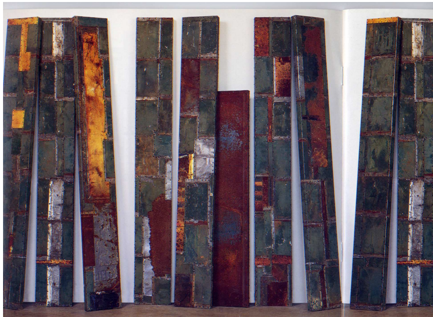
Figura 2. Mobile Construction-Trees (2000), Nick Cave. Mesures variables entre 4'-12'x1'. Allentown Museum of Art, Allentown, PA