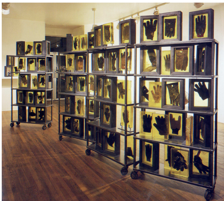
Figura 8. Truss (imatge de la instal·lació) (1992), Nick Cave

Cal ser pacient i donar suport a les idees i les lectures dels estudiants de la diferència, per tal de desplegar expectatives, tot establint un espai de respecte que generi interaccions interpersonals, i permetent que enganxen l'educador amb els diferents grups. Encoratjar l'alumnat per fomentar i abraçar les diverses formes de ser que hi ha al món és el gran regal que l'educador pot compartir amb tots els seus estudiants, i no només