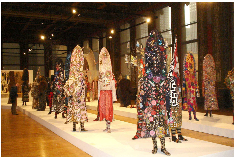
Figura 7. Imatge de la instal·lació Soundsuits (2006), Nick Cave. Chicago Cultural Center

Animo els educadors a reconèixer la utilització de l'amarga ironia en l'obra de Cave, comentant-la, durant la seva participació en les convocatòries de màrqueting comercial 3 . Hem de valorar els coneixements enciclopèdics de Nick pel que fa a l'art, la seva fascinació per la cultura popular i pels esdeveniments actuals, ja que tots aquests elements estan sovint al cos central de la seva obra. Nick Cave no és un artista que treballa en una torre d'ivori, sinó que protesta pels detritus que generen les restes del capitalisme consumista contemporani, i proposa una recuperació que consisteix en reutilitzar la