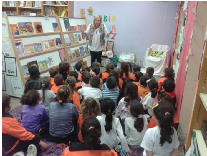
La Biblioteca es un espacio integrado en la vida del centro educativo

Se concibe por tanto la biblioteca escolar como un espacio integrado en la vida del centro educativo, que forma parte de pleno derecho de sus prácticas pedagógicas y en consonancia con lo contemplado en su Proyecto Educativo (un proyecto educativo vivo, flexible e integrador de los aprendizajes) donde no solo se acude con voluntad de disfrutar de la lectura, de leer por placer, de tomar contacto con historias y personajes que desarrollen la imaginación y la creatividad del alumnado sino también como un espacio que facilite y fomente el desarrollo curricular y los aprendizajes imprescindibles, donde el alumnado adquiera habilidades lectoras y donde la lectura productiva tenga también cabida.