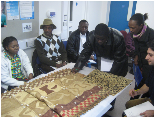
Fig. 2. Cultura y Lengua inglesa , 2010-2011: ejemplo de talleres.