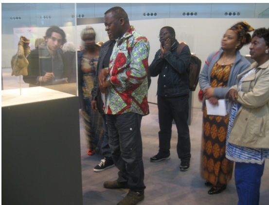
Fig. 3 Encuentros interculturales, 2012 : ejemplo de co-moderación de talleres en la colección permanente.