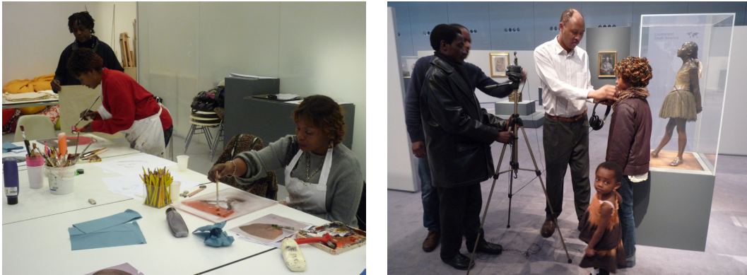
Fig. 1. Su Pasado Tu Futuro , 2008-2010: taller de video y producción de diseños inspirados en la colección.