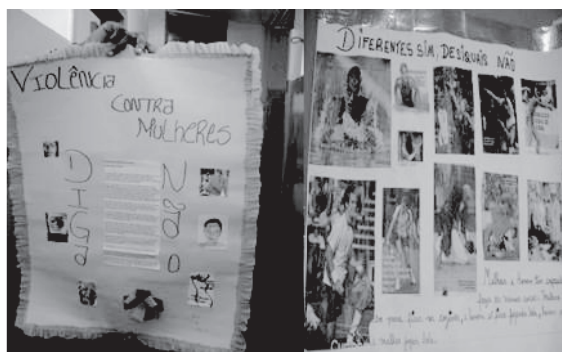
Figura 4. Cartells de la campanya contra la desigualtat i la violència de gènere

El segon projecte, la investigació duta a terme pels estudiants per identificar situacions de desigualtat i de violència en els conflictes de gènere viscuts per aquesta comunitat, també va tenir com a punt de partida els conflictes relatats pels estudiants. Es va fer així perquè, en reflexionar sobre ells mateixos, un grup d'estudiants va suggerir escoltar les persones del barri (els seus pares i parents) amb l'objectiu de tenir informació més precisa sobre la realitat del barri. Amb l'orientació d'una professora i ajudats per materials que van obtenir a través d'investigacions bibliogràfiques, els estudiants van elaborar una guia per a entrevistes i van sortir als carrers del barri a entrevistar dones i homes. A continuació presentem quatre treballs dels estudiants: els dos primers són fruit d'anàlisis fetes a partir dels informes obtinguts a través de les entrevistes (que van ser exposats al mural de l'escola); els dos últims són cartells que es van fer i utilitzar durant la campanya dels estudiants, a l'escola i al barri, contra la desigualtat i la violència de gènere.