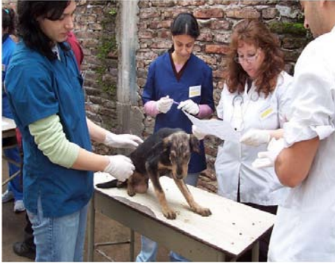
Figura 4. El Proyecto Piletones és una pràctica APS de la Facultat de Veterinària de la Universitat de Buenos Aires, adreçada a la prevenció de les malalties zoonòtiques en un dels barris més desfavorits de la ciutat.

Ara fa 14 anys, el Ministeri d'Educació, en col·laboració amb CLAYSS (Centro Latinoamericano de Aprendizaje y Servicio Solidario), va convocar per primer cop un seminari internacional sobre aprenentatge servei, que s'ha anat repetint cada any, associat fins fa poc a l'atorgament de premis «presidencials» sobre APS, al qual s'hi presenten centres educatius de tots els nivells.