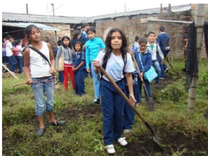
Figura 5. El Proyecto Agricultura urbana és una pràctica APS de l'escola Los Comuneros, de Popayán, que consisteix en la recuperació i difusió de la tradició agrícola i l'alimentació saludable entre la població.

No hi ha control específic per part de les administracions acadèmiques. En la mesura en què per llei el SSOE forma part del projecte educatiu del centre, quan hi ha una inspecció, aquesta també supervisa com està funcionant el SSOE.