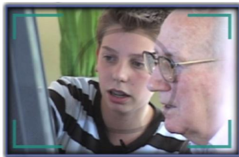
Figura 6. Ensenyar informàtica a la gent gran és una de les pràctiques més habituals del civic intership holandès.

Per dirigir aquest procés es va constituir un equip coordinador a nivell nacional, amb dues institucions per al desenvolupament social encarregades, cadascuna, d'un sector diferent: CPS va liderar el procés amb el sector educatiu i MOVISIE el va liderar amb el sector de les organitzacions socials proveïdores de les activitats de servei.