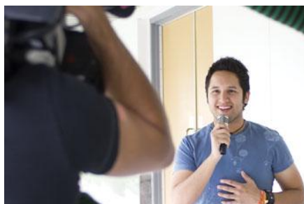
Figura 2. Producció audiovisual para ONG's és una pràctica APS a la Facultad de Ciencias de la Información y la Comunicación del Tec de Monterrey

És una metodologia educativa basada en una experiència solidària, en la qual els estudiants, docents i membres de la comunitat treballen i aprenen junts per a resoldre necessitats específiques de la comunitat, utilitzant el coneixement i realitzant transferència de coneixement per al bé comú. (Benavides, 2007)