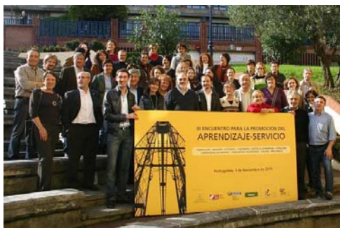
Figura 7. Constitució de la Red Española de Aprendizaje-Servicio a Portugalete, País Basc, el novembre de 2010

La definició d'aprenentatge servei que s'està difonent a Espanya és l'elaborada pel Centre Promotor Aprenentatge Servei: «És una proposta educativa que combina processos d'aprenentatge i de servei a la comunitat en un sol projecte ben articulat en el qual els participants es formen tot treballant sobre necessitats reals de l'entorn amb la finalitat de millorar-lo».