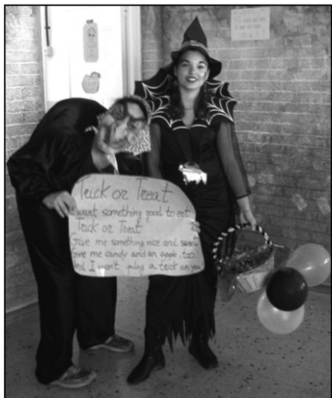
"Trick or treat, I want something good to eat..."

Concluimos de la misma manera que empezamos: "¿Celebrar o no celebrar Halloween?" Desde el Departamento de Inglés pensamos que educar íntegramente es dar a conocer diferentes culturas, así pues nuestro objetivo no fue inculcarles a los alumnos que se celebre cada año esta festividad sino informar sobre un aspecto de la cultura anglosajona.