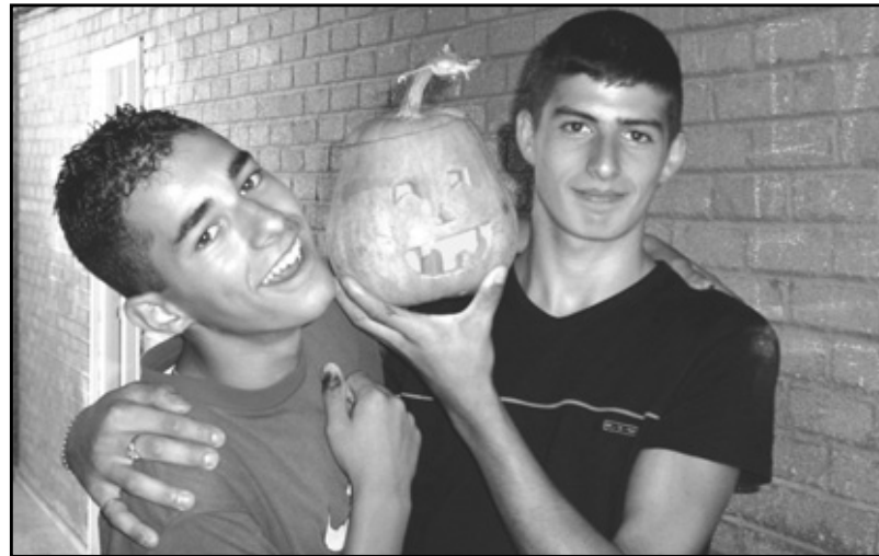
¿Te gusta nuestra "Jack-o-lantern"?

los alumnos tuvieran que hacer uso del diccionario y fomentar así el trabajo en equipo.