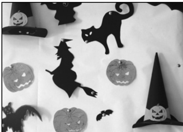
Un rincón adornado del Centro