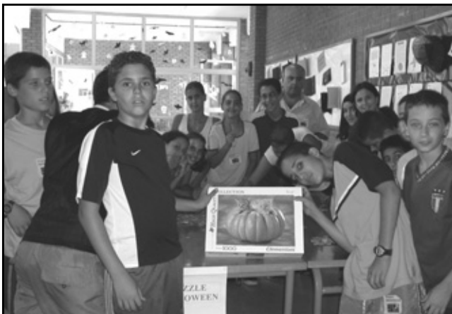
Nuestro puzzle, como no, de calabazas

Aparte de todos estos talleres, se realizó uno común para el Primer Ciclo de la ESO: un puzzle de mil piezas sobre Halloween. Cada grupo de alumnos/as iba completando el puzzle, a partir de lo que ya estaba hecho.