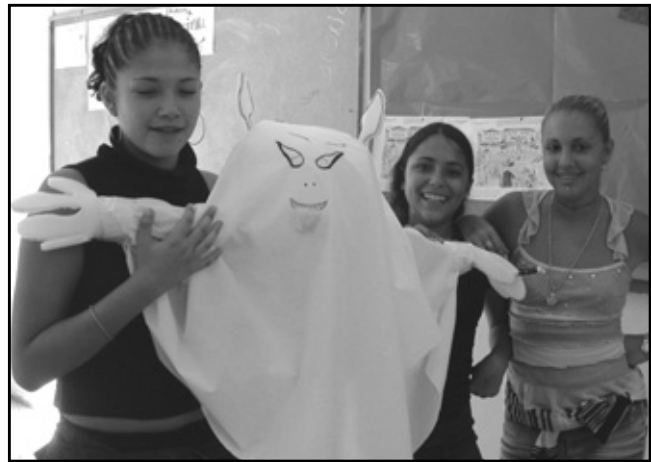
Uno de los fantasmas que realizaron nuestros alumnos/as

A raíz de dicha celebración, notamos que los alumnos se sienten más motivados hacia la asignatura y se ha logrado crear un ambiente más positivo en las clases de inglés. La valoración no sólo desde el Departamento, sino por parte de padres, alumnos y el resto de profesores ha sido altamente positiva.