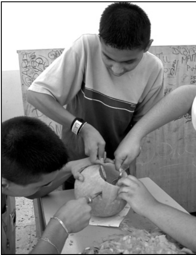
Ya estamos acabando...

El último taller era "La calabaza Jack-o-lantern". De todos los talleres que se llevaron a la práctica éste fue el que más entusiasmo y motivación creó entre el alumnado.