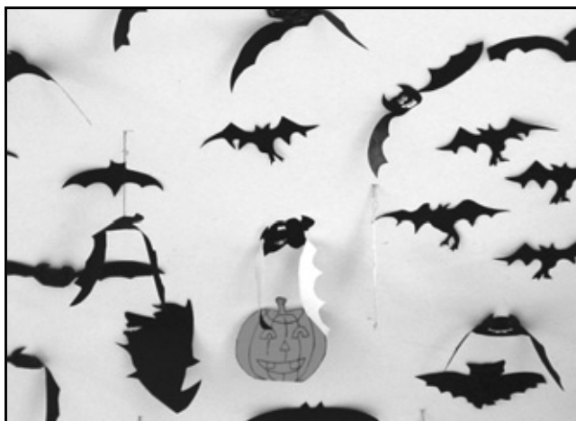
Móviles realizados por el alumnado

Todos los profesores que colaboraron en los talleres recibieron un dossier informativo con la organización de los mismos. Cada uno duró aproximadamente 35 minutos, lo que hizo posible que los alumnos/as rotaran por cada taller.