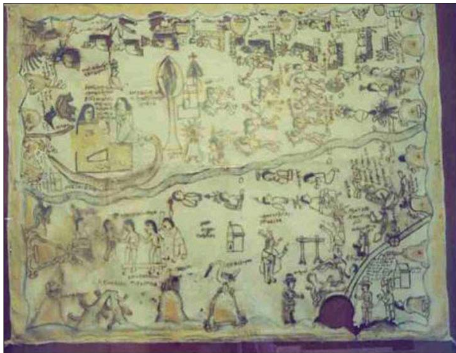
Figura 1. Lienzo de Aztactepec y Citlaltepec (Códice de las vejaciones), s. XVI. Museo Alfeñique de Puebla.

Hay que subrayar el hecho de que el Códice de las vejaciones no sea un mapa, ni tenga una intencionalidad descriptiva; sino una función narrativa: una crónica sobre varios sucesos diferenciados, que tienen en común el haber afectado a los pobladores de una u otra manera. Las característi-