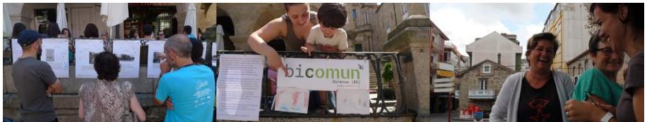
Fig. 6. Nada sería posible sin todo el mundo que se acerca, participa, sonríe y conversa

BIComún es un concepto en expansión, un proceso de experimentación y desarrollo que todavía está empezando y en la que han colaborado muchas personas y