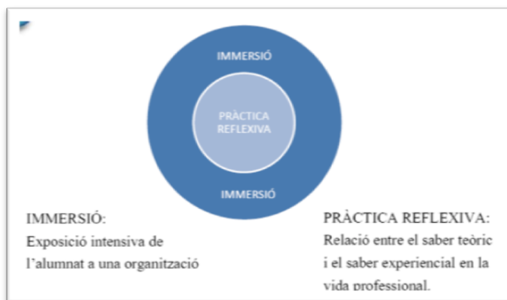
Fig. 3. Metodologia de les pràctiques externes (Aneas et al., 2012)